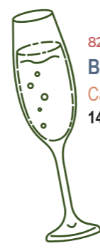
822 Brut Nature Cava 14,00 €