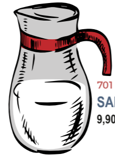
701 SANGRÍA 9,90 €