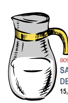
809 SANGRÍA DE CAVA 15,00 €